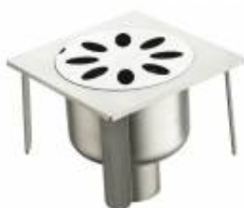
PZCSQR10020006 Pozzetto carrabile sifonato serie SQUARE 20 cm