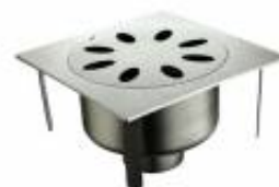
PZCSQR13030006 Pozzetto carrabile sifonato serie SQUARE 30 cm