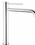
RBNMOD0A10105 Miscelatore lavabo ottone alto serie MODE