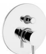
RBNMOO0150105 Miscelatore doccia ottone incasso con deviatore serie MODE ONE