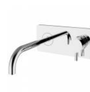
RBNMOO0110105 Miscelatore lavabo incasso ottone con piastra MODE ONE