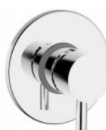
RBNMOO0050105 Miscelatore doccia ottone incasso serie MODE ONE