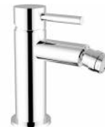
RBNMOO0020105 Miscelatore bidet ottone serie MODE ONE