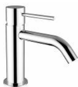
RBNMOD0010105 Miscelatore lavabo ottone serie MODE