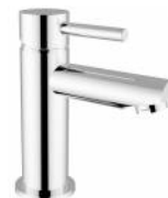
RBNMOO0010105 Miscelatore lavabo ottone serie MODE ONE