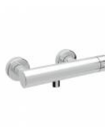
RBNMOO0040105 Miscelatore doccia ottone a parete serie MODE ONE