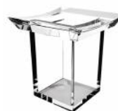
BTAFRZ3240105 Porta bicchiere d'appoggio ottone serie FIRENZE