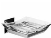
BTAFRZ0140105 Porta sapone ottone serie FIRENZE