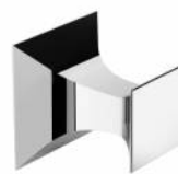
BTAFRZ0400105 Appendino ottone serie FIRENZE