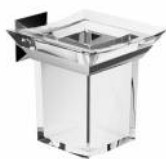
BTAFRZ0240105 Porta bicchiere ottone serie FIRENZE