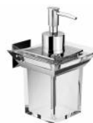
BTAFRZ0340105 Dispenser ottone serie FIRENZE