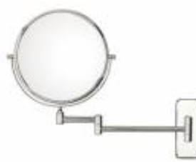
MRRCNF0023005 Specchio cosmetico ingranditore serie CONFORT 230