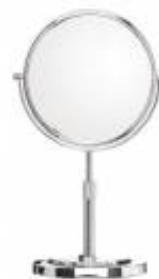
MRRCNF0024005 Specchio cosmetico ingranditore serie CONFORT 240