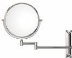
MRRCNF0022005 Specchio cosmetico ingranditore serie CONFORT 220