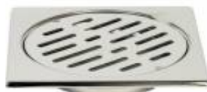
CPRSQR0110005 Copertura pavimento griglia fissa serie SQUADRA