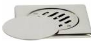
CPRSQR0210005 Copertura pavimento griglia fissa tappo mobile serie SQUADRA