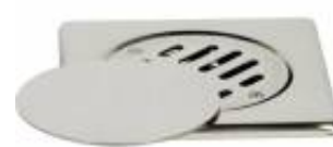
CPRSQR0415005 Copertura pavimento griglia e tappo mobile serie SQUADRA