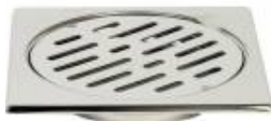
CPRSQR0110005 Copertura pavimento griglia fissa serie SQUADRA